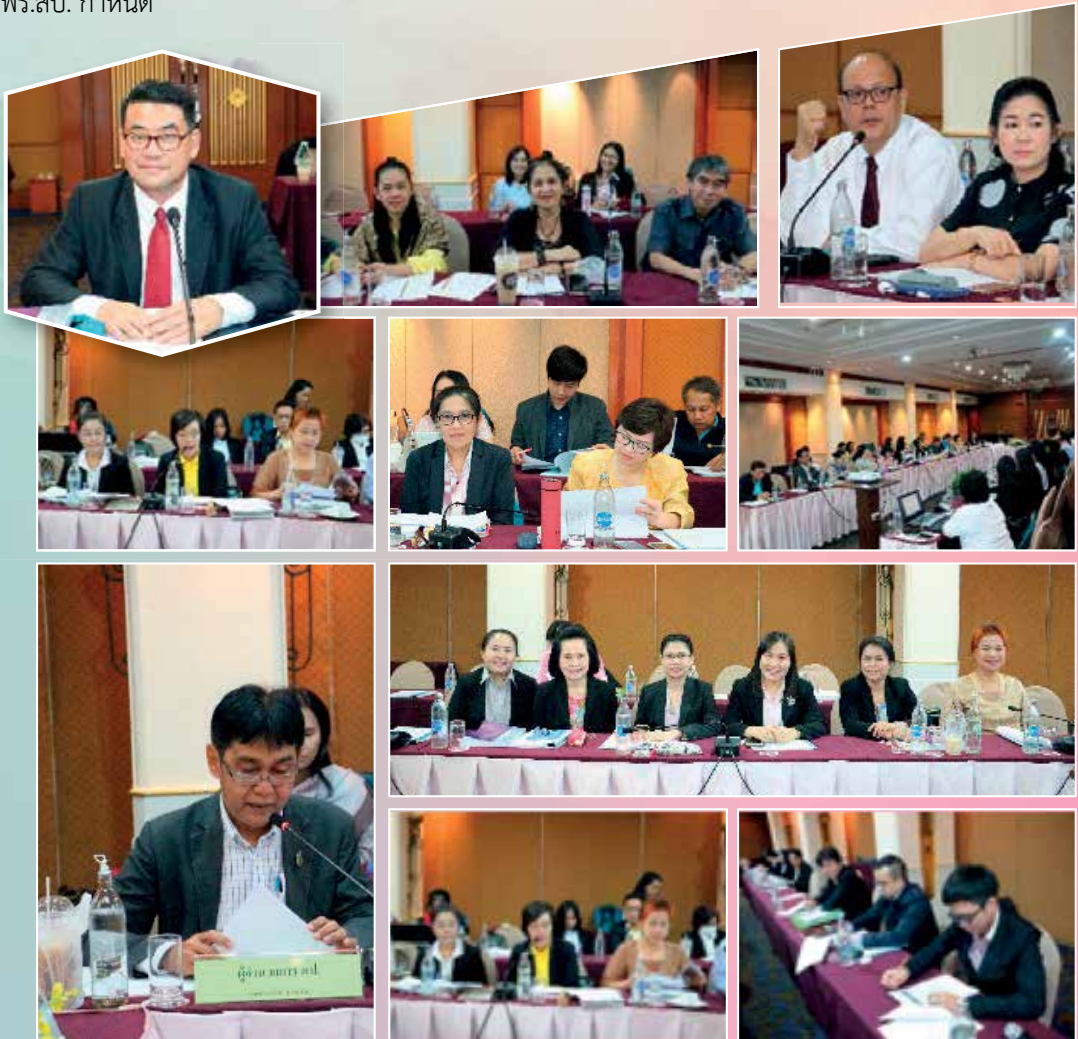
ภาพ/ข่าว นปภา โพธิ์พ่วง