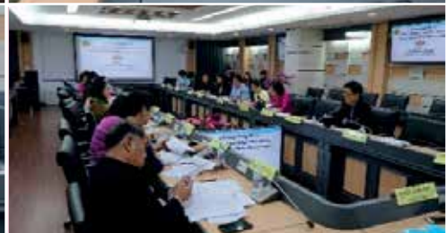
ภาพ/ข่าว ธราวดี วิชัยดิษฐ์