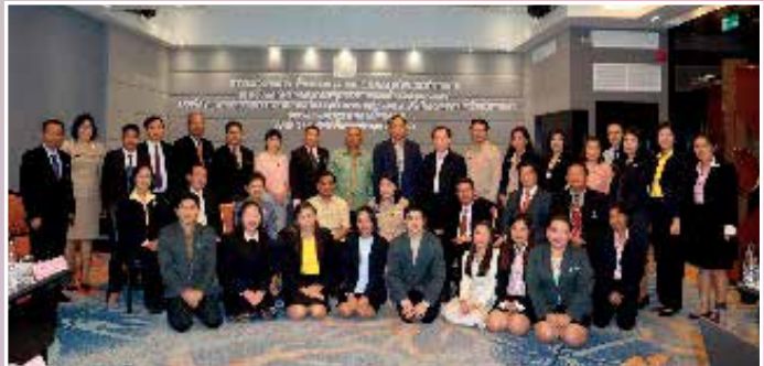
ภาพ/ข่าว นปภา โพธิ์พวง