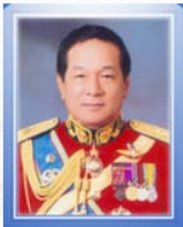
พลเอก อรุณ สมตัน กรรมการการวิสามัญ