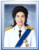
ศาสตราจารย์ นิสดาร์ก เวชยานนท์ โฆษกคณะกรรมการอภิศาสนาจารย์